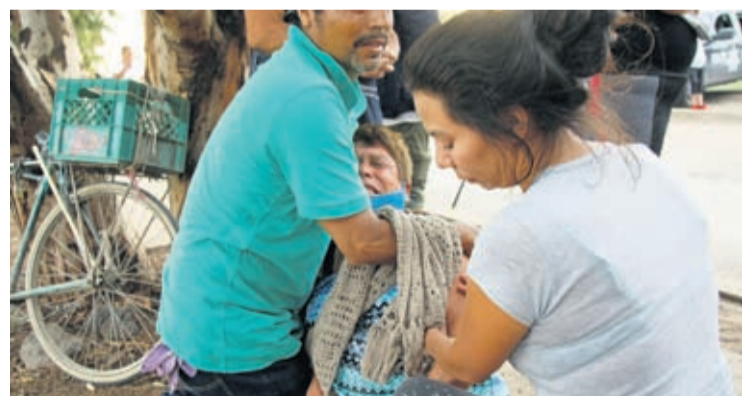
Relatives comfort a woman crying outside an unregistered drug rehabilitation center in Irapuato, Mexico, Wednesday, July 1, 2020, after gunmen burst into the facility and opened fire.